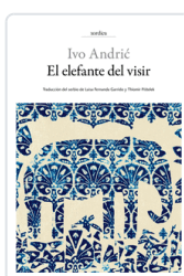
ELEFANTE DEL VISIR ANDRIC, IVO