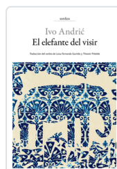
ELEFANTE DEL VISIR ANDRIC, IVO