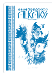
ALKAIOS VOLUMEN II BONILLA, ADRIAN