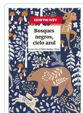
BOSQUES NEGROS, CIELO AZUL IVEY, EOWYN