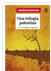
UNA TRILOGIA PALESTINA KANAFANI, GASAN