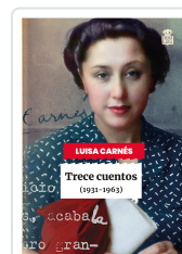
TRECE CUENTOS CARNÉS CABALLERO, LUISA