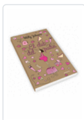
CLUB DEL PUDÍN, EL JOHNSON, MILLY