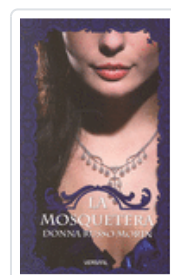
MOSQUETERA, LA RUSSO, DONNA