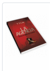
AGENCIA. UNA ESPIA EN CASA Y S LEE