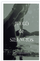
JUEGO DE SILENCIOS CORNUDELLA, EVA