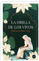
ORILLA DE LOS VIVOS DE PABLO ORTIZ, RODRIGO