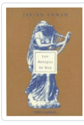
BOSQUES DE NYX, LOS TOMEO, JAVIER