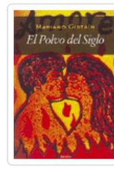
POLVO DEL SIGLO, EL 2/E GISTAIN, MARIANO