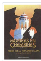
MORIRAS EN CHAFARINAS (LA PELICULA) LALANA / OLEA