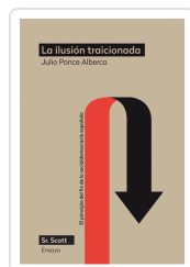
ILUSION TRAICIONADA, LA PONCE ALBERCA, JULIO