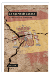
AGONIA DE ESPAÑA DE JIMENEZ, ANTONINI