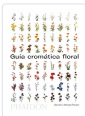
GUIA CROMATICA FLORAL PUTNAM, DARROCH AND MICHAEL