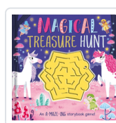
MAGICAL TREASURE HUNT (ING) AA.VV.