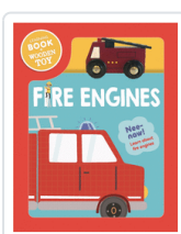
FIRE ENGINES WOODEN VEHICLE SET (ING) AA.VV.