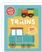
TRAINS-BOOK & WOODEN VEHICLE (ING) AA.VV.