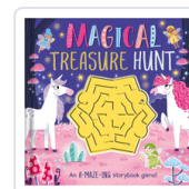
MAGICAL TREASURE HUNT (ING) AA.VV.