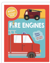
FIRE ENGINES WOODEN VEHICLE SET (ING) AA.VV.