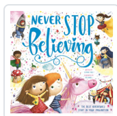
NEVER STOP BELIEVING (ING) IGLOOBOOKS