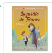
LAZARILLO DE TORMES SOLE, JORDI