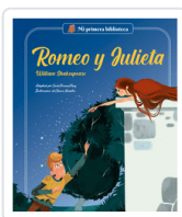
ROMEO Y JULIETA (MI PRIMERA BIBLIOTECA) SHAKESPEARE / PASCUAL ROIG, CARLA