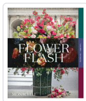
FLOWER FASH MILLER, LEWIS