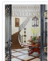
EXTRAORDINARY INTERIORS TUCKER, SUZANNE