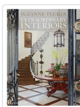
EXTRAORDINARY INTERIORS TUCKER, SUZANNE