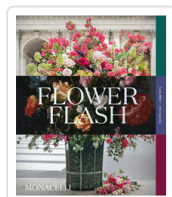
FLOWER FLASH MILLER, LEWIS