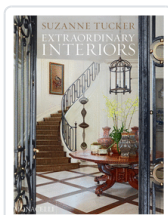
EXTRAORDINARY INTERIORS TUCKER, SUZANNE