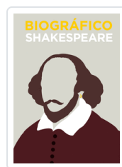
BIOGRÁFICO SHAKESPEARE (OFERTA) CROOT, VIV