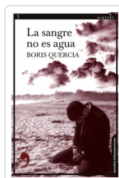
SANGRE NO ES AGUA QUERCIA, BORIS