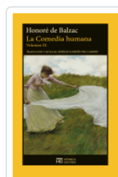
COMEDIA HUMANA (9) BALZAC, HONORE