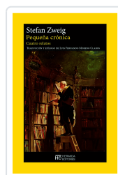
PEQUEÑA CRONICA ZWEIG, STEFAN