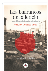
LOS BARRANCOS DEL SILENCIO GONZALEZ TEJERA, FRANCISCO