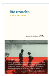
RIO REVUELTO DIDION DUNNE, JOAN