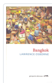
BANGKOK OSBORNE, LAWRENCE