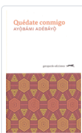
QUÉDATE CONMIGO ADEBAYO, AYOBAMI