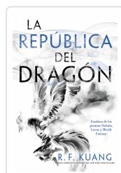
LA REPÚBLICA DEL DRAGÓN KUANG, R.F.