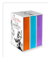
ESTUCHE GUERRA DE LA AMAPOLA (SAGA COMPLETA) KUANG, R.F.