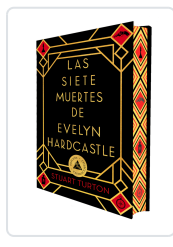
LAS SIETE MUERTES DE EVELYN HARDCASTLE (CANTOS PINTADOS) TURTON, STUART