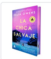
LA CHICA SALVAJE (ED. ESPECIAL LIMITADA CANTOS PINTADOS) OWENS, DELIA