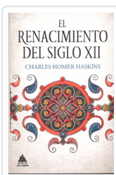
RENACIMIENTO DE SIGLO XII HASKINS, CHARLES HOMER