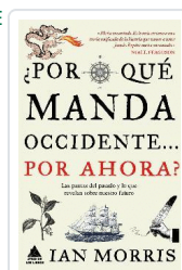
POR QUE MANDA OCCIDENTE POR AHORA MORRIS, IAN