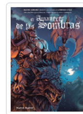
AMANECER DE LAS SOMBRAS ARRANZ / DIAZ