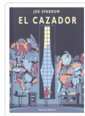
CAZADOR SPARROW, JOE