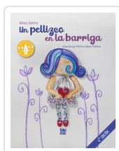
UN PELLIZCO EN LA BARRIGA SERRA, ALMA