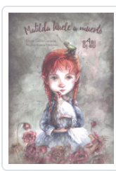
MATILDA HUELE A MUERTO GARCIA CARRERAS, GLORIA