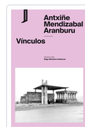
VINCULOS MENDIZABAL ARANBURU, ANTXIÑE