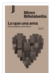
LO QUE UNA AMA BILLEABEITIA, MIREN