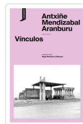
VINCULOS MENDIZABAL ARANBURU, ANTXIÑE