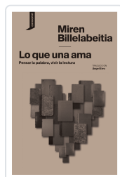
LO QUE UNA AMA BILLEABEITIA, MIREN