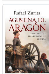
Agustina de Aragón Zurita, Rafael