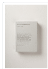
ARCHITECTURE AND TECHNOLOGY-FUTURE OF CITIES AA.VV.