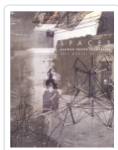
SPACES NORMAN FOSTER FOUNDATION BALLESTER, JOSE MANUEL