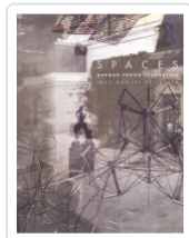
SPACES NORMAN FOSTER FOUNDATION BALLESTER, JOSE MANUEL