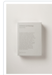
ARCHITECTURE AND TECHNOLOGY-FUTURE OF CITIES AA.VV.