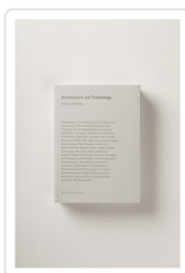
ARCHITECTURE AND TECHNOLOGY-FUTURE OF CITIES AA.VV.