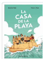
CASA DE LA PLAYA VIDAL / PINET