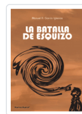
BATALLA DE ESQUIZO GARCIA IGLESIAS, MANUEL A.