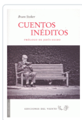
CUENTOS INEDITOS STOKER, BRAM