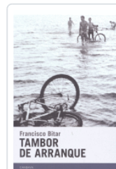
TAMBOR DE ARRANQUE BITAR, FRANCISCO