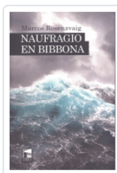
NAUFRAGIO EN BIBBONA ROSENZVAIG, MARCOS