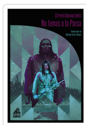
NO TEMAS A LA PARCA JONES, STEPHEN GRAHAM