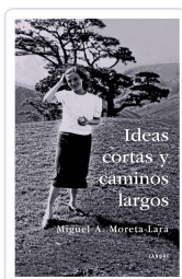
IDEAS CORTAS Y CAMINOS LARGOS MORETA-LARA, MIGUEL A.