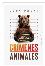
CRIMENES ANIMALES ROACH, MARY