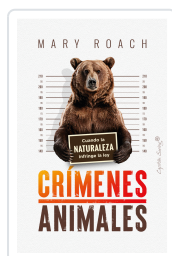
CRIMENES ANIMALES ROACH, MARY