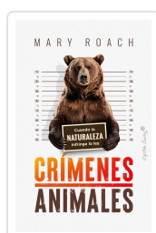
CRÍMENES ANIMALES ROACH, MARY