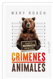
CRIMENES ANIMALES ROACH, MARY