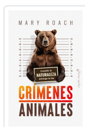
CRÍMENES ANIMALES ROACH, MARY