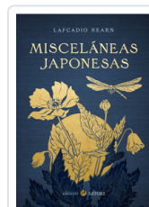
MISCELÁNEAS JAPONESAS HEARN, LAFCADIO