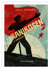
KANIKOSEN. EL CANGREJERO Y OTROS RELATOS PROLETARIOS KOBAYASHI, TAKIJI