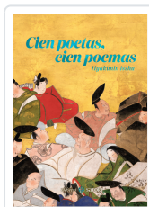
CIENT POETAS, CIENT POEMAS TEIKA, FUJIWARA NO