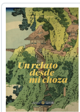
UN RELATO DESDE MI CHOZA CHOMEI, KAMO NO