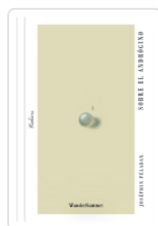
SOBRE EL ANDRÓGINO PELADAN, JOSEPHIN