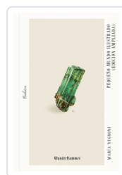
PEQUEÑO MUNDO ILUSTRADO N/EA NEGRONI, MARIA