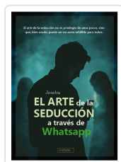
ARTE DE LA SEDUCCIÓN A TRAVÉS DE WHATSAPP, EL JOSEBA