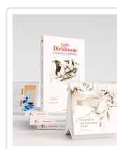
PACK EL SECRETO DE LA OROPENDOLA DICKINSON, EMILY