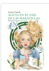
ALICIA EN EL PAÍS DE LAS MARAVILLAS CARROLL, LEWIS