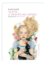
ALICIA A TRAVÉS DEL ESPEJO CARROLL, LEWIS