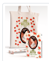
PACK 250 ANIVERSARIO JANE AUSTEN AUSTEN, JANE