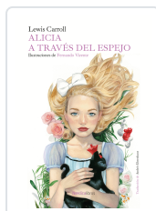
ALICIA A TRAVÉS DEL ESPEJO CARROLL, LEWIS