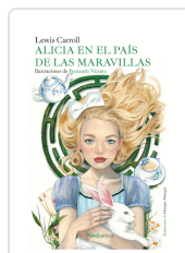
ALICIA EN EL PAIS DE LAS MARAVILLAS CARROLL, LEWIS