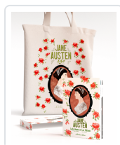
PACK 250 ANIVERSARIO JANE AUSTEN AUSTEN, JANE