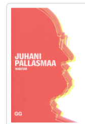
HABITAR PALLASMAA, JUHANI