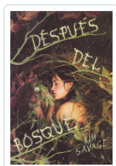
DESPUES DEL BOSQUE SAVAGE, KIM